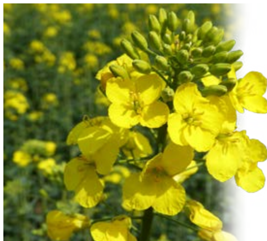
Plon nasion rzepaku ozimego odmiany RGT BONANZA według COBORU (2013 - 2016)